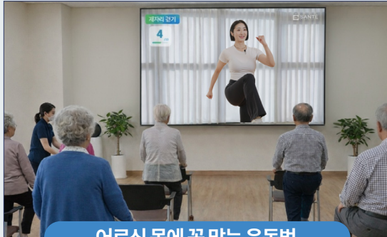
어르신 몸에 꼭 맞는 운동법 + 신체기능 점수에 따라 개별 케어 +

보호자가 직접 확인하는 건강 모니터링 앱 + 센터와 보호자 사이의 신뢰 형성 +