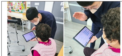
물리치료사 선생님께서 어르신께 측정 결과를 알려주고 계시는 모습

이렇게 어르신들은 자신의 신체기능의 객관적인 평가들 그자리에서 바로바로 확인 할수 있고 화목한재활주간보호센터의 물리치료사 선생님께 직접 피드백을 받아 현재의 상태에 대해 쉽게 파악하실수가 있습니다. 평가로 끝나는 것이 아니라 어르신들의 독립적인 일상생활의 수행능력을 높이기 위해 결과에 따라 재활 훈련, 물리치료 및 기타 지원 서비스의 필요성을 진단할수 있습니다. 또한 어르신들의 기능 변화 추적을 통해 치매나 기타 질병의 진행 상황을 모니터링 할수 있습니다.