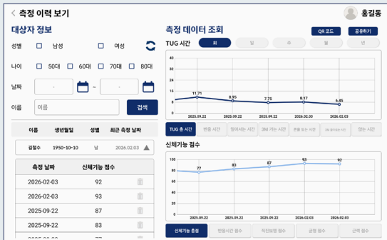
한눈에 보는 어르신 신체기능 변화 + 센터 내 모든 어르신을 한번에 관리 +